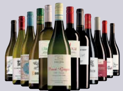
Prijzen onder voorbehoud van druk- en zetfouten