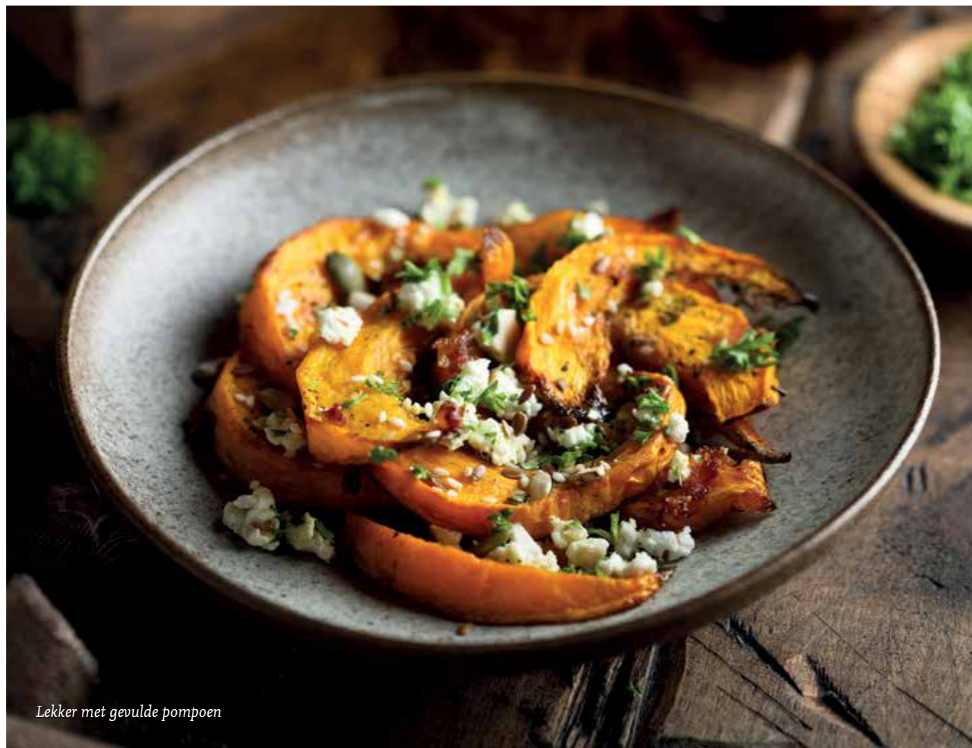
Lekker met gevulde pompoen