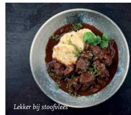
Lekker bij stoofvlees