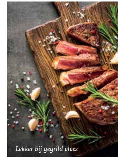
Lekker bij gegrild vlees

★★★★★ Zeer goed PERSWIJN - MEI/JUNI 2024 (OOGST 2021)