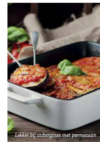
Lekker bij aubergines met parmezaan