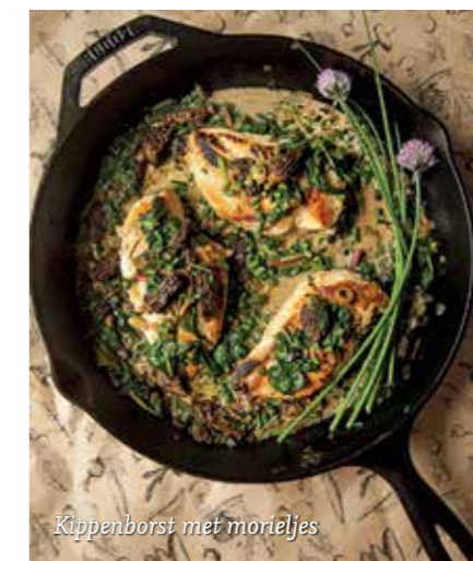
Kippenborst met morelles