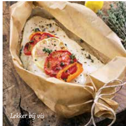
Lekker bij vis