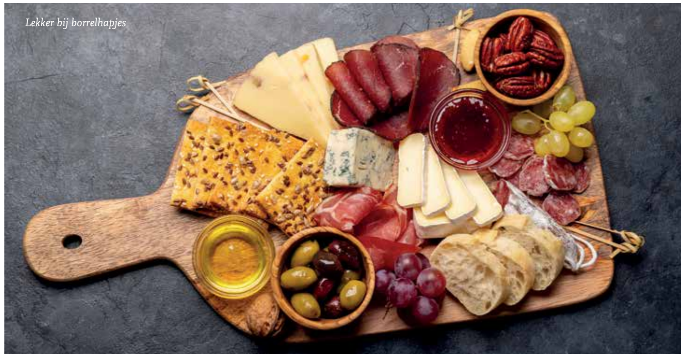
Lekker bij borrelhapjes