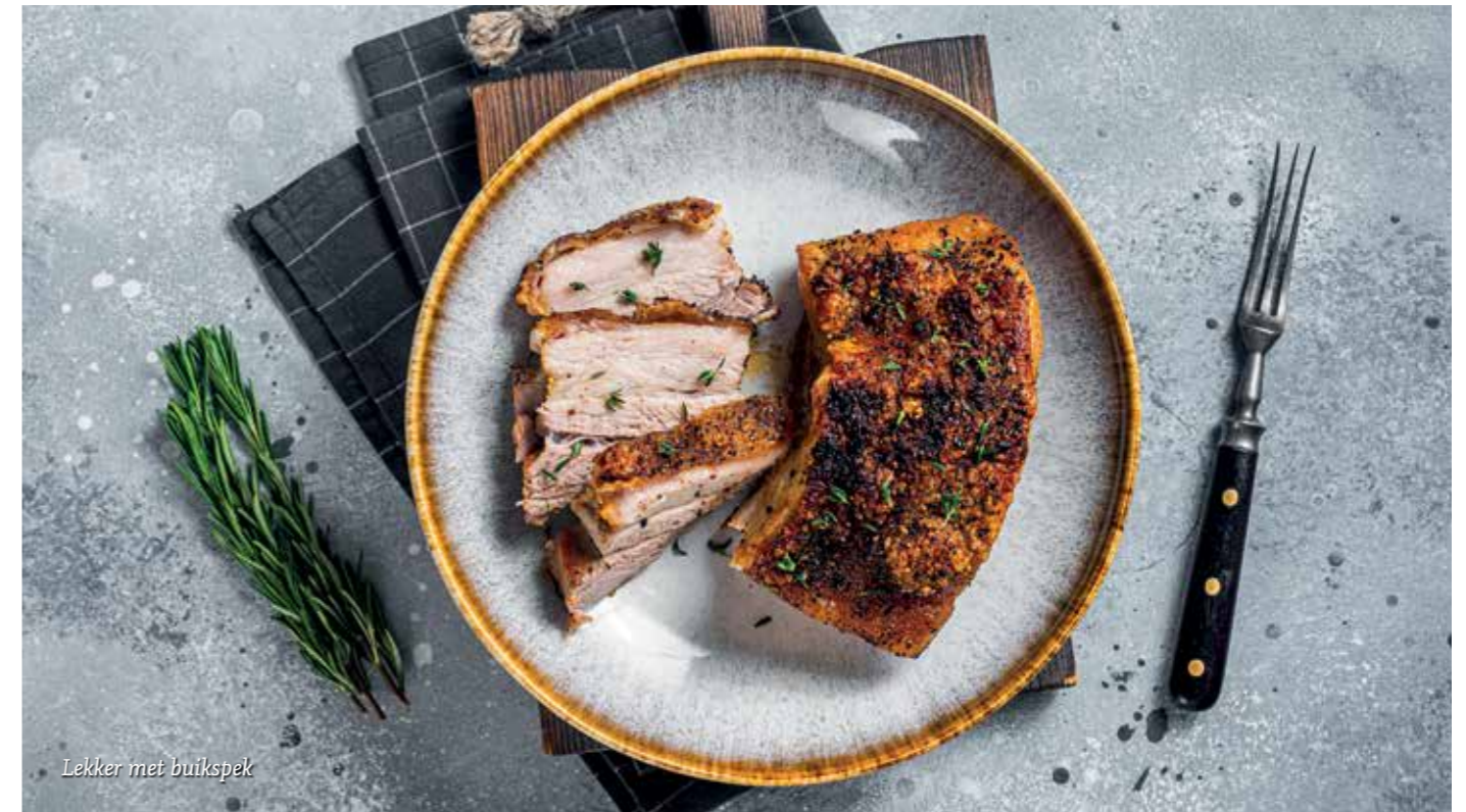
Lekker met buikspek